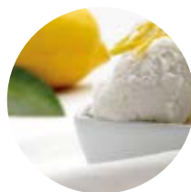
Limone di Sicilia spremuto a freddo