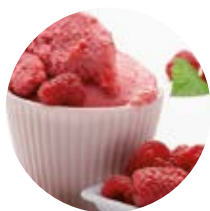
Lampone con lamponi italiani