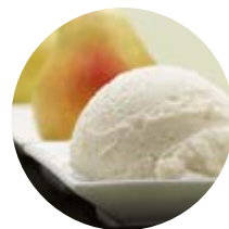
Pera con pere conference