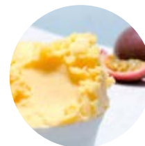
Frutto della passione del centro America