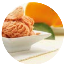
Arancia rossa spremuta a freddo

I nostri sorbetti pur non contenendo latte e grassi anche per esaltare la frutta selezionata con cui sono fatti, hanno una consistenza più simile a quella del gelato grazie alla nostra tecnica di mantecazione. Sono molto gustosi e dissetanti, ma al tempo stesso non molto calorici poiché contengono solo 140Kcal/100gr circa.