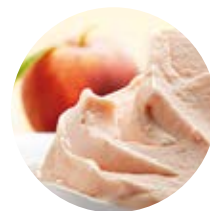
Pesca con pesche qualità gialla