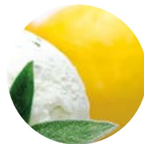
Limone e salvia con limone di Sicilia e salvia