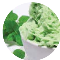
Menta piperita piemontese