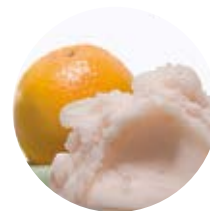
Pompelmo rosa di Sicilia