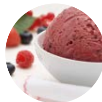
Frutti di bosco more selvatiche, lamponi e fragole camarosa