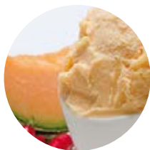
Melone e peperoncino