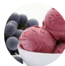
Uva fragola del Piemonte