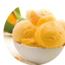
Mandarino tardivo di Ciaculli PRESIDIO SLOW FOOD