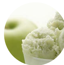
Mela verde Granny Smith