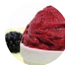
Gelso nero di Sicilia