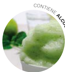
Mojito con menta piemontese e limone candito